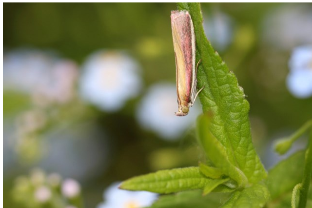
Figuur 1 prachtmot

Sommige soorten laten zich nog moeilijker vinden. Daarom heb je soms wat hulp nodig. Met van een felle lamp en een wit laken wordt het zoeken al een stuk makkelijker. Insecten, met name nachtvlinders, worden door dit felle licht aangetrokken. Hierdoor kun je ze ineens een stuk beter bekijken. Ook zie je dan nachtvlinders dat niet alleen maar 'saaie bruine motten' zijn. Als je goed kijkt hebben ze de mooiste kleuren, vormen en namen. Kijk bijvoorbeeld maar eens naar deze fraaie en zeldzame prachtmot !