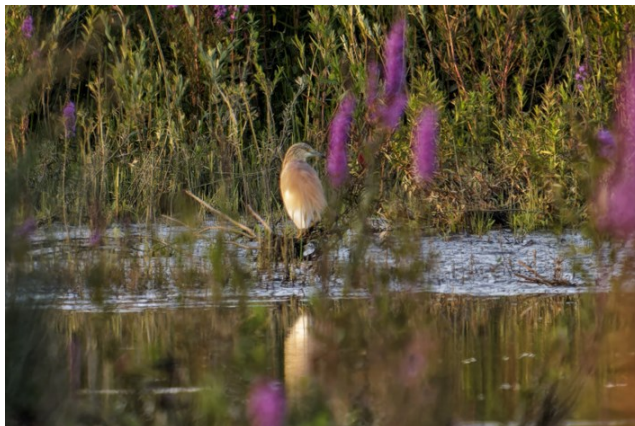
Figuur 2 Ralreiger

Een soort die opvallend weinig in de Noordwaard gezien wordt is de kanaaljuffer . Deze libel lijkt op veel andere juffer-soorten en komt niet vaak bij de oever, hierdoor wordt hij waarschijnlijk veel over het hoofd gezien.