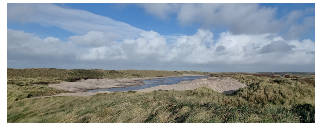
Duinherstel Meeuwenduinen 2023

Enorme machines in de Meeuwenduinen en op Kooisplek waren er eind vorig jaar te zien. Met ogenschijnlijk grof geweld werden struiken en dikke graspakketten verwijderd. Kaal zand kwam er voor terug. Ook hier hetzelfde doel; open duinlandschap behouden en biodiversiteit vergroten. Binnen een jaar waren de eerste resultaten al zichtbaar. Onze ecooloog Jan Meijer houdt goed in de gaten wat de ontwikkelingen daar zijn. Binnen een jaar groeiden er al heelblaadje en waterranonkel. De verwachting en hoop is dat ook de moeraswespenorchis, parnassia en waterpunge zich daar gaat vestigen. Ook kranswieren en fonteinkruiden zouden er kunnen gaan groeien. Al deze planten dragen bij aan de broodnodige biodiversiteit in de vochtige kalkrijke duinvalleien.