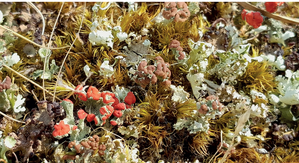
Grijze duinen zijn niet grijs | Foto: Jan Meijer