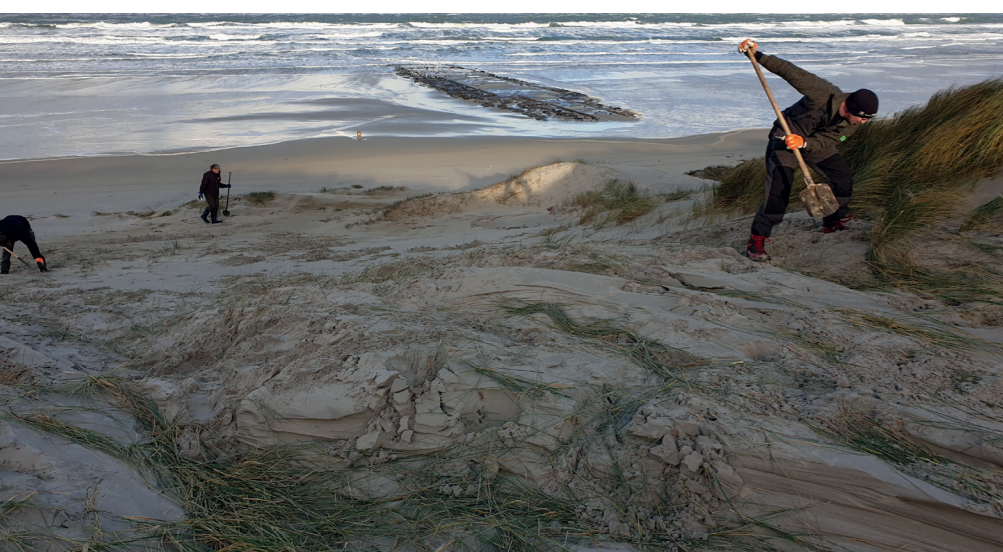
Handmatig helm verwijderen in de kerf bij Pad van 20